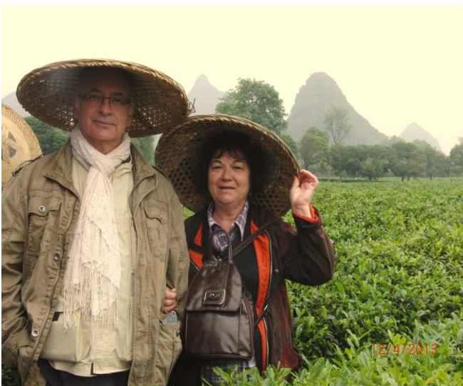
Nos organisateurs de voyages en Chine