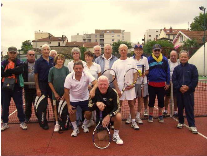
Tournoi de septembre APICIL-TONIC / C.M.C.V.