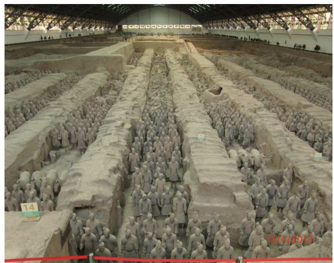
L'armée enterrée des soldats en terre cuite