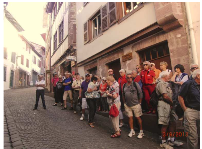
Le groupe en voyage dans le sud-ouest