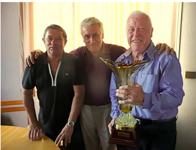
Tournoi FOUJOLS avril 2013