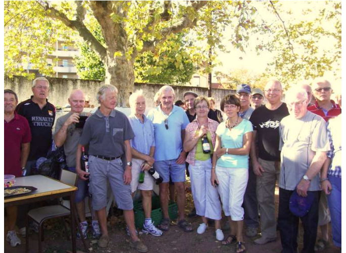
Les vainqueurs du tournoi de pétanque