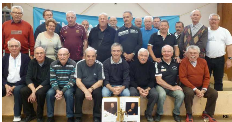
Les habitués des matinées Tennis des lundis et jeudis à l'ASUL.