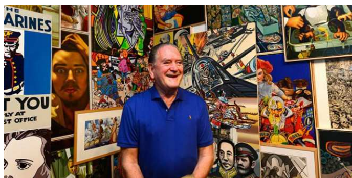
Exposition ERRO Musée d'art Contemporain ci-dessus