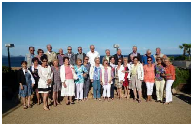
Participants au stage 2016